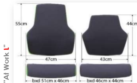
"At Work L"